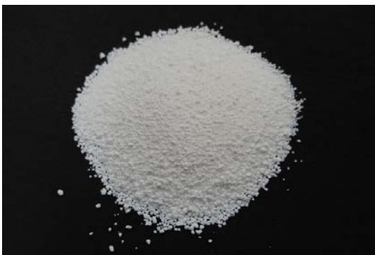
倍率 × 1