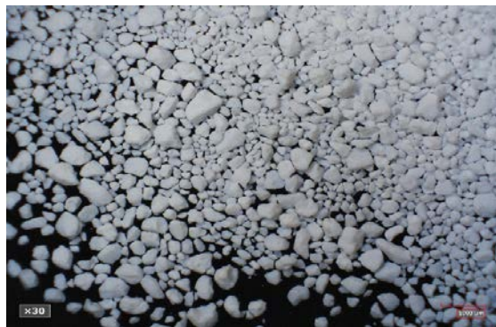
倍率 × 30