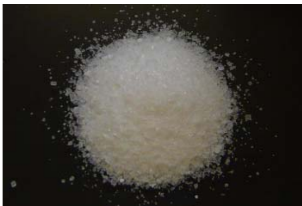
倍率 × 1