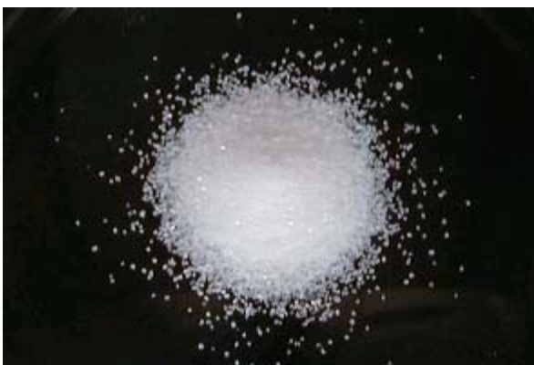
倍率 \times 1