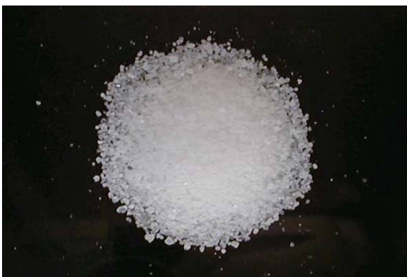
倍率 \times 1